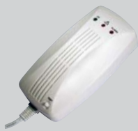
Photo-elektrischer Rauchmelder mit integrierter Sirene, geprüft nach DIN 14 676 und VdS, von Feuerwehren, Brandschutzbeauftragten und VdS empfohlen. Anschluss via Funkübertragung.